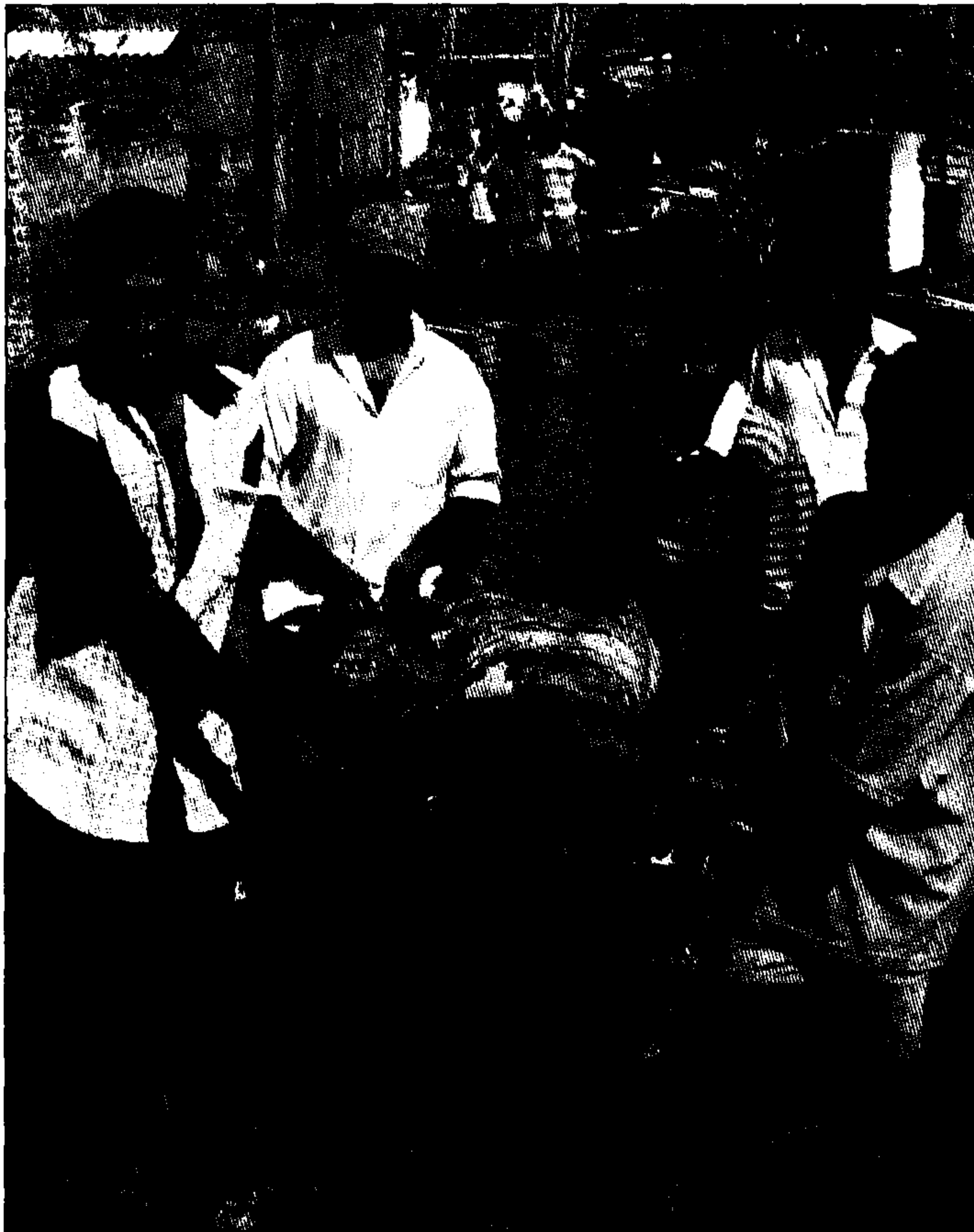
Il recupero di uno dei tanti cadaveri nello Sri Lanka

Le squadre di soccorso, ha detto Purnomo Sidik, direttore della sezione disastri naturali del ministero degli Affari sociali indonesiano, hanno scoperto che 10.000 persone sono morte in una sola città, Meulaboh, nella provincia di Aceh. Aceh è nella punta settentrionale di Sumatra, l'isola più vicina all'epicentro, la regione più devastata dall'Indonesia, devastata dal muro di mare di dieci metri che è arrivato silenzioso, senza preavviso, senza che la gente avesse avuto il